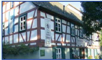
Haltestelle Schloss Philippsruhe

Landstraße 4 63454 Hanau Telefon: (0 61 81) 25 47 06 mo. – so. 18.00 - 24.00 Uhr Küche bis 23.00 Uhr