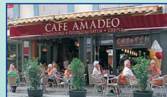
Haltestelle Freiheitsplatz / Marktplatz

Nürnberger Straße 35 63450 Hanau Telefon: (0 61 81) 50 83 78 8 www.cafe-amadeo.de 6.00 Uhr - 19.00 Uhr