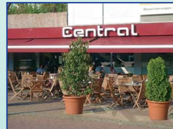
Haltestelle Freiheitsplatz / Marktplatz

Café & Australian Bar Am Markt 21 b 63450 Hanau Telefon: (07 00) 222 00 999 www.central-hanau.de so. – do. 8.00 – 1.00 Uhr und fr. + sa. 8.00 – 3.00 Uhr